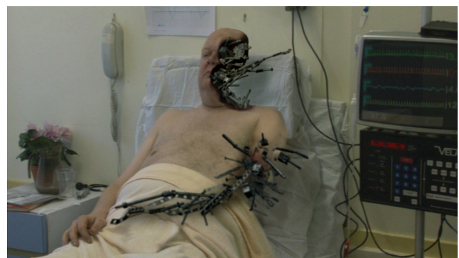
Still: Metalosis Maligna van Floris Kaayk