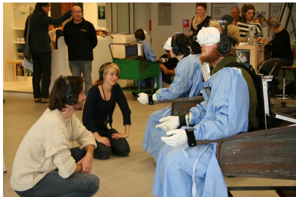
C.A.P.E performances op diverse locaties