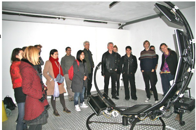
workshop nav. Bolscan

De groep richtte zich op artistieke toepassingen binnen de door CREW ontwikkelde Bolscan -installatie, die je naar eigen goeddunken laat rondkijken in een 360°, bolvormig filmbeeld. De interactieve Bolscan is tegengesteld van een flatscreen en de geleide blik. Het is een object dat je de gelegenheid geeft om vrij rond te kijken in rondom aanwezig beeld. Je kan de actie in de omni-directionale film scannen per segment. Je kan dus zelf bepalen welk beeld van een 360° filmsequentie je wilt zien.