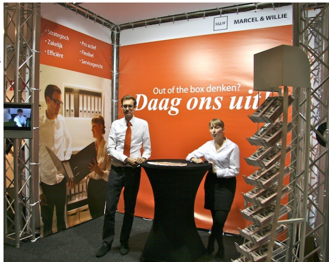
M & W zakelijke dienstverlening

Publiek: ca. 6000 voorbijgangers / ca. 400 actief geïnteresseerden